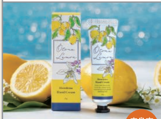
ハンドクリーム・入浴料