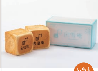
冷凍食パン・クロワッサン